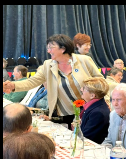
Journée festive des seniors