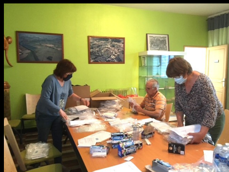
Début de mandat atypique marqué par la distribution de masques et la mise en place d'un centre de vaccination !

Ces quelques images retracent les moments marquants et les réalisations qui ont façonné notre commune au cours des six dernières années. Ce panorama ne prétend pas être exhaustif, tant les initiatives ont été nombreuses, mais il illustre l'engagement constant de toutes les forces vives.