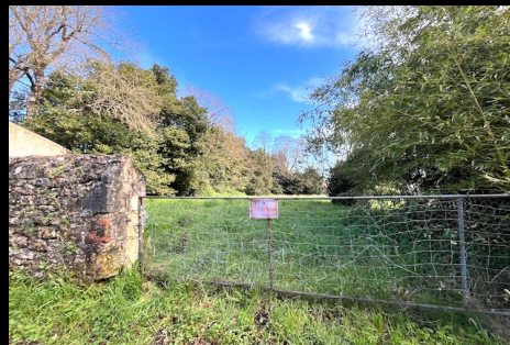
Achat de parcelle à Gauput