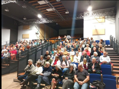
Nouveaux gradins de la salle Culturelle