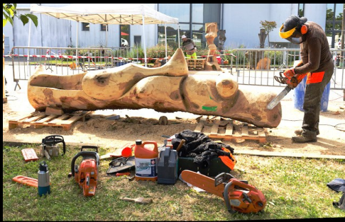
Symposium de sculpture monumentale