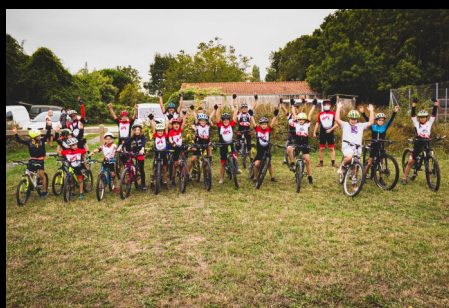
Soutien aux associations sportives