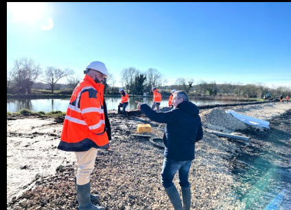
Extension de la station d'épuration