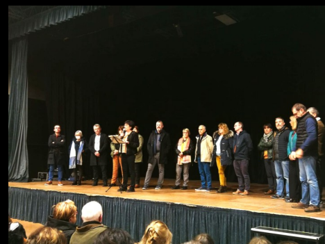
Cérémonies des vœux