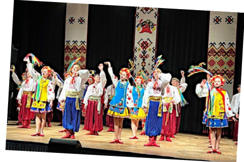
La troupe des Joyeux Petits Souliers

Depuis le début de l'année, la commune a accueilli quatre magnifiques spectacles : une représentation de théâtre en janvier, le spectacle de Laurent Savard, le ballet ukrainien ainsi qu'un spectacle dédié aux enfants, The bear du duo OCCO en partenariat avec les Musiques Actuelles de la CARO.