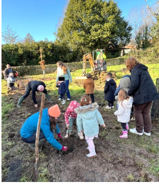
Plantations avec les enfants