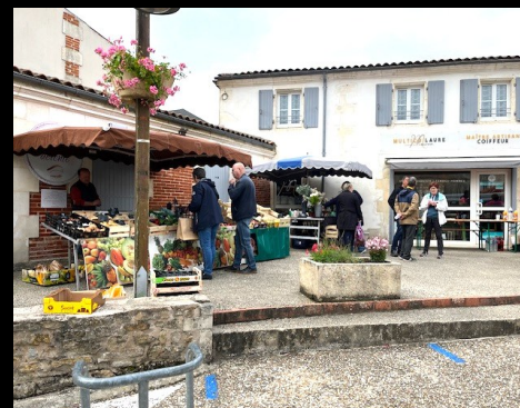
Revitalisation de la place des Caneteries