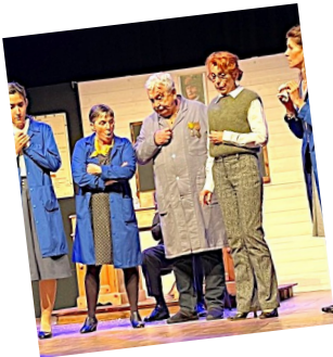
Été 42, bienvenue les enfants - Les Baladins

C'est un travail collectif. Sans l'engagement de la commune aux côtés des associations, et sans l'investissement précieux des bénévoles associatifs, rien ne serait possible. Ensemble, nous faisons vivre notre territoire, nous créons des rencontres, du partage et du lien social.