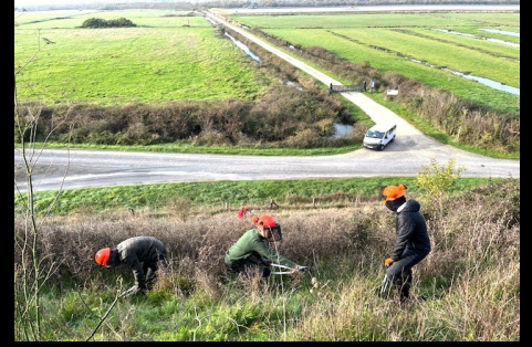
Renaturation du coteau de Liron