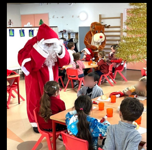
École : Rentrée scolaire - Ateliers périscolaires - Fête de Noël