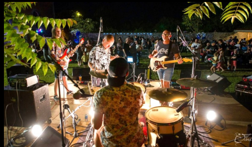
Soutien aux événements culturels