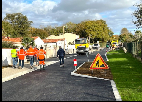
Réfection de voirie - Effacement de réseau - Création de cheminements doux