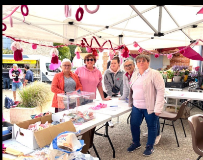
... et la marche rose