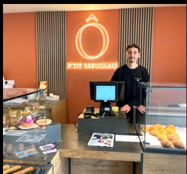
Arrivée de nouveaux commerçants après des travaux