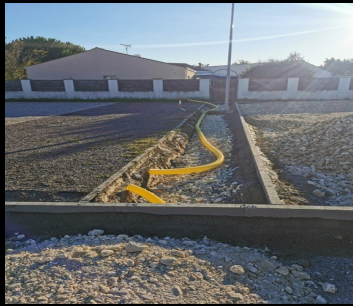
Parking aux Caneteries