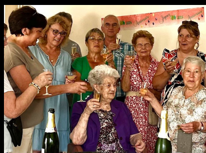
Hommage à notre centenaire