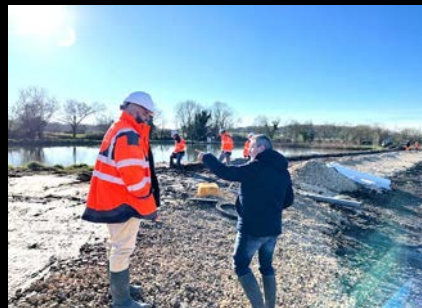
Extension de la station d'épuration