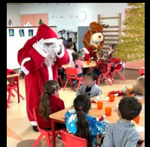
École : Rentrée scolaire - Ateliers périscolaires - Fête de Noël