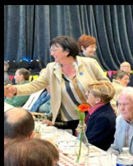
Journée festive des seniors