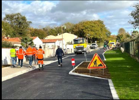
Réfection de voirie - Effacement de réseau - Création de cheminements doux