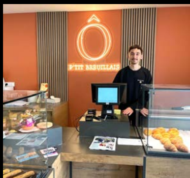
Arrivée de nouveaux commerçants après des travaux