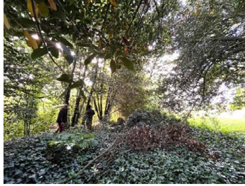
Diagnostic près de la mare par Aunis GD

La réhabilitation de l'extension du parc de Gauput est actuellement en cours. Des plantations ont été réalisées en début d'année afin d'amorcer la renaturation du site.