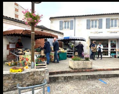
Revitalisation de la place des Caneteries