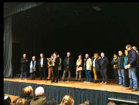
Cérémonies des vœux