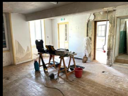
Le Vestiaire en travaux