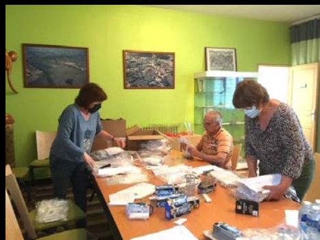
Début de mandat atypique marqué par la distribution de masques et la mise en place d'un centre de vaccination !

Ces quelques images retracent les moments marquants et les réalisations qui ont façonné notre commune au cours des six dernières années. Ce panorama ne prétend pas être exhaustif, tant les initiatives ont été nombreuses, mais il illustre l'engagement constant de toutes les forces vives.