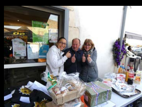
Solidarité pour le Téléthon ...