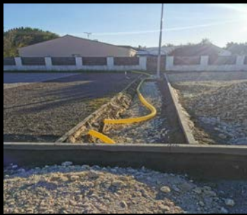
Parking aux Caneteries