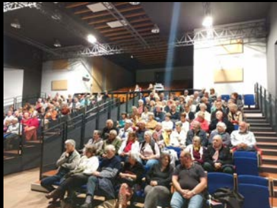
Nouveaux gradins de la salle Culturelle