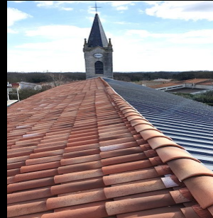
Rénovation énergétique - Travaux dans l'église