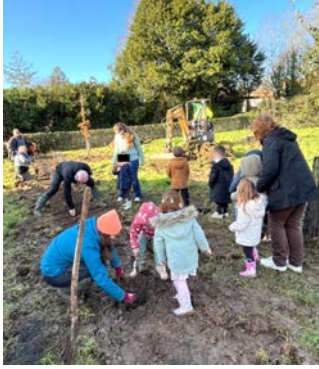
Plantations avec les enfants