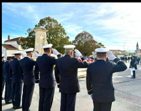
Cérémonie de commémoration avec le Conseil municipal des jeunes