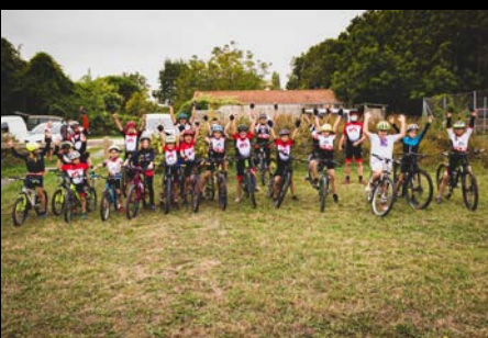
Soutien aux associations sportives