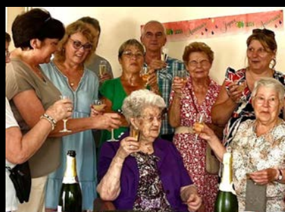
Hommage à notre centenaire