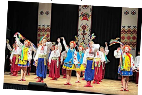
La troupe des Joyeux Petits Souliers

Depuis le début de l'année, la commune a accueilli quatre magnifiques spectacles : une représentation de théâtre en janvier, le spectacle de Laurent Savard, le ballet ukrainien ainsi qu'un spectacle dédié aux enfants, The bear du duo OCCO en partenariat avec les Musiques Actuelles de la CARO.