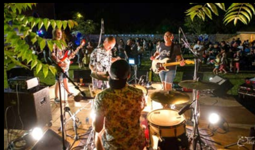
Soutien aux événements culturels