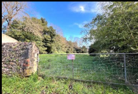
Achat de parcelle à Gauput