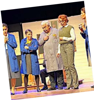
Été 42, bienvenue les enfants - Les Baladins

C'est un travail collectif. Sans l'engagement de la commune aux côtés des associations, et sans l'investissement précieux des bénévoles associatifs, rien ne serait possible. Ensemble, nous faisons vivre notre territoire, nous créons des rencontres, du partage et du lien social.