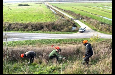
Renaturation du coteau de Liron