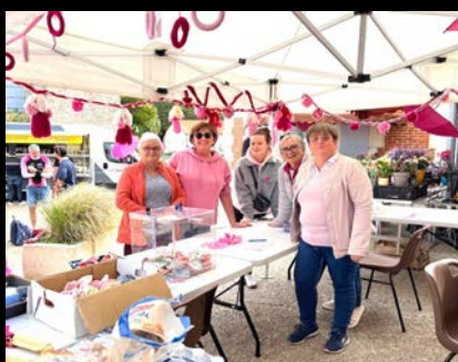
... et la marche rose