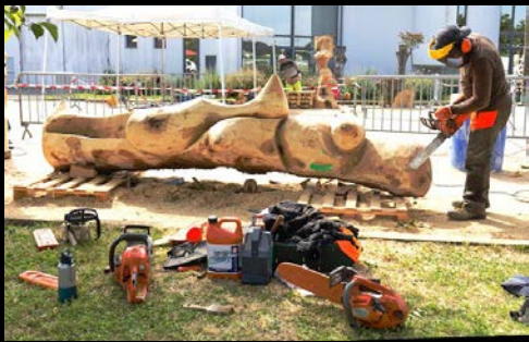
Symposium de sculpture monumentale