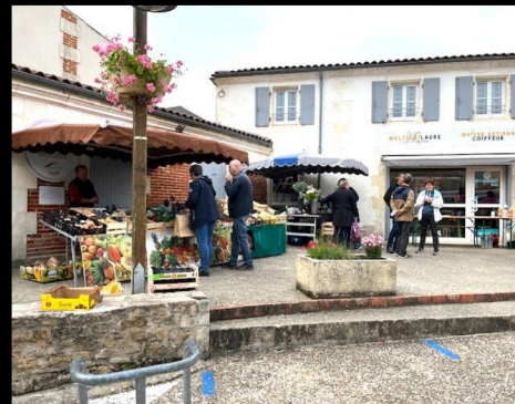
Revitalisation de la place des Caneteries