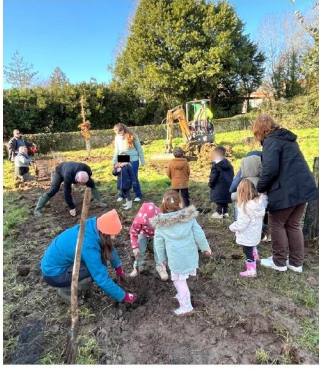
Plantations avec les enfants