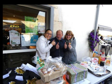
Solidarité pour le Téléthon ...