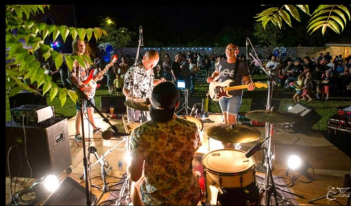
Soutien aux événements culturels