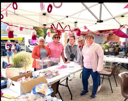
... et la marche rose