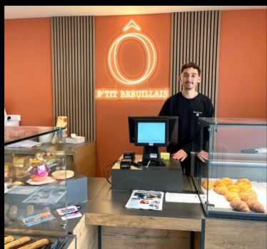
Arrivée de nouveaux commerçants après des travaux