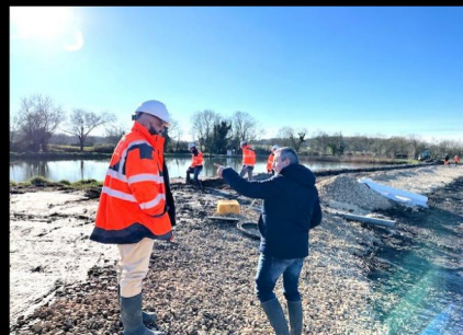
Extension de la station d'épuration