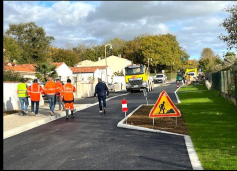
Réfection de voirie - Effacement de réseau - Création de cheminements doux