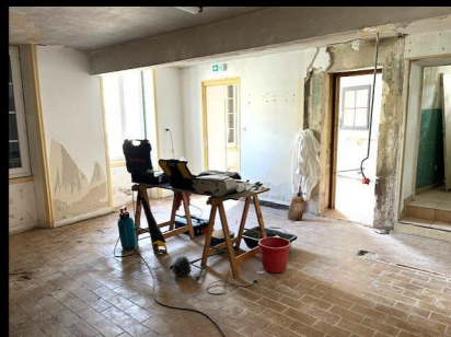
Le Vestiaire en travaux