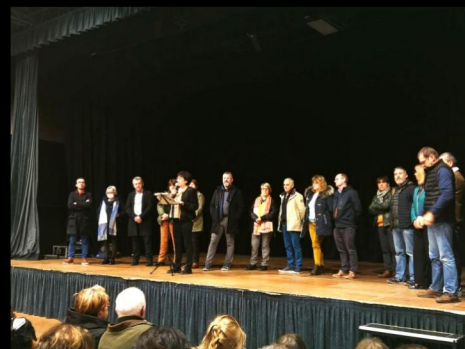
Cérémonies des vœux