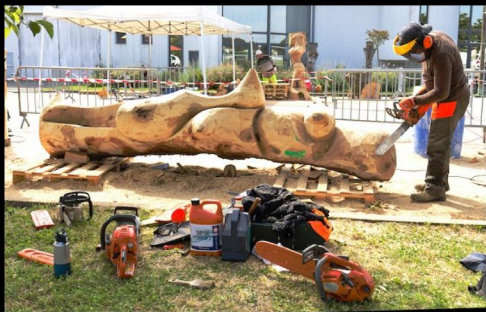
Symposium de sculpture monumentale