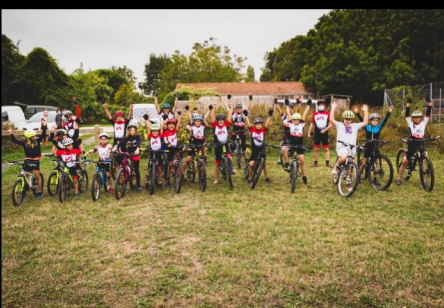
Soutien aux associations sportives