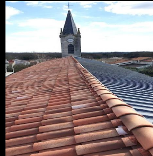
Rénovation énergétique - Travaux dans l'église