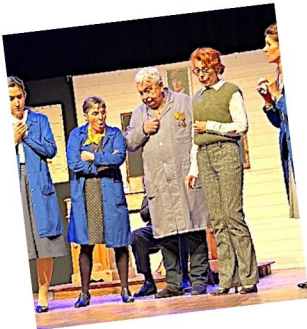
Été 42, bienvenue les enfants - Les Baladins

C'est un travail collectif. Sans l'engagement de la commune aux côtés des associations, et sans l'investissement précieux des bénévoles associatifs, rien ne serait possible. Ensemble, nous faisons vivre notre territoire, nous créons des rencontres, du partage et du lien social.