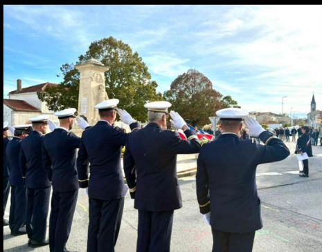
Cérémonie de commémoration avec le Conseil municipal des jeunes