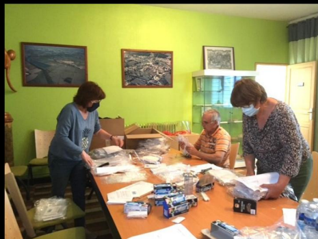
Début de mandat atypique marqué par la distribution de masques et la mise en place d'un centre de vaccination !

Ces quelques images retracent les moments marquants et les réalisations qui ont façonné notre commune au cours des six dernières années. Ce panorama ne prétend pas être exhaustif, tant les initiatives ont été nombreuses, mais il illustre l'engagement constant de toutes les forces vives.