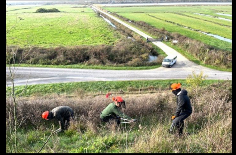
Renaturation du coteau de Liron