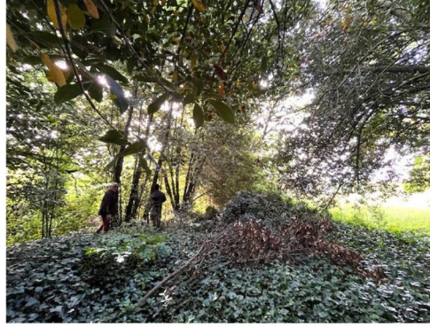
Diagnostic près de la mare par Aunis GD

La réhabilitation de l'extension du parc de Gauput est actuellement en cours. Des plantations ont été réalisées en début d'année afin d'amorcer la renaturation du site.