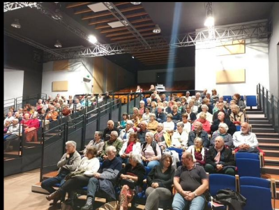
Nouveaux gradins de la salle Culturelle