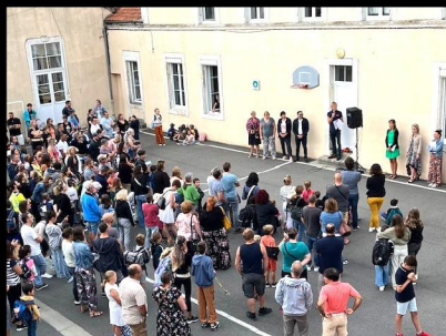
École : Rentrée scolaire - Ateliers périscolaires - Fête de Noël