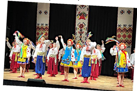
La troupe des Joyeux Petits Souliers

Depuis le début de l'année, la commune a accueilli quatre magnifiques spectacles : une représentation de théâtre en janvier, le spectacle de Laurent Savard, le ballet ukrainien ainsi qu'un spectacle dédié aux enfants, The bear du duo OCCO en partenariat avec les Musiques Actuelles de la CARO.