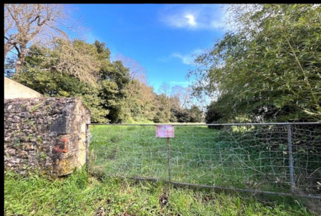
Achat de parcelle à Gauput