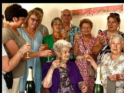
Hommage à notre centenaire