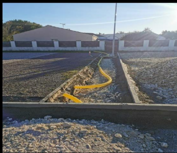
Parking aux Caneteries