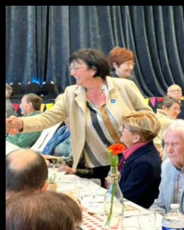
Journée festive des seniors